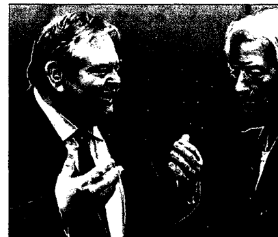
100 MACHTSPIEL: Schon die Griechen Steuerflüchtlinge?