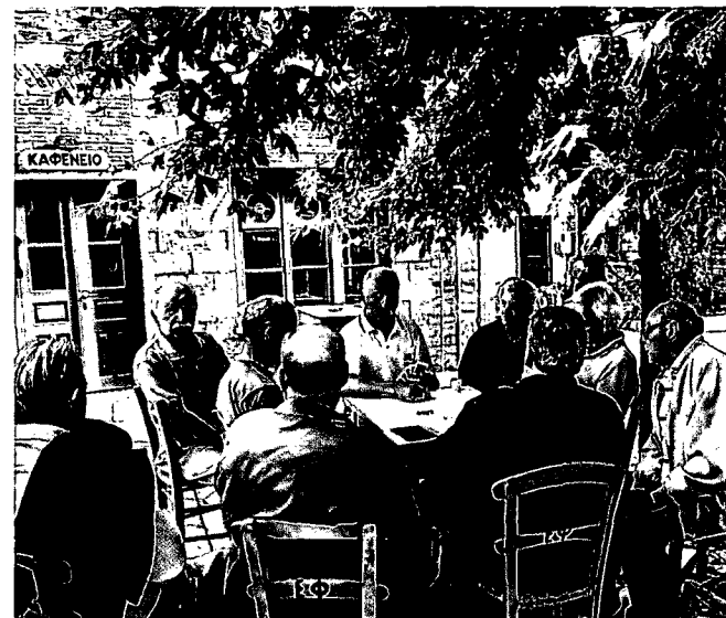
78 PILION: Ein Ort zum Wiederkommen