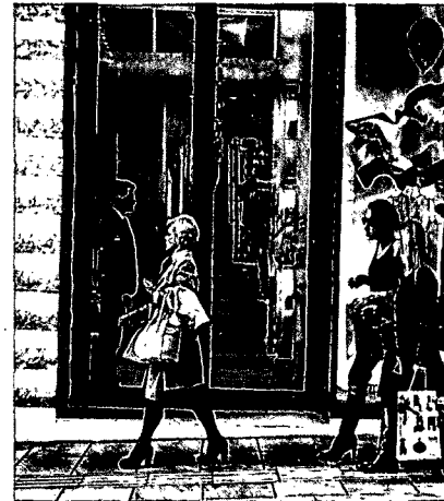
46 ATHEN: Wo High Society auf Revoluzzertum trifft

TITEL: JUAN CARLOS F. MORATA, SANTORINI REDAKTIONSSCHLUSS: 15. JANUAR 2015