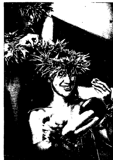
118 HULA LEBT: Beim größten Tanzwettbewerb der Inseln

TITEL: HAWAII COLIN ANDERSON REDAKTIONSSCHLUSS: 12. SEPTEMBER 2014