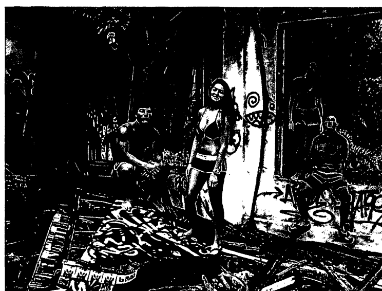
88 SHAKA FÜR EINEN KRIEGER: Vom Jungsein auf Hawaii