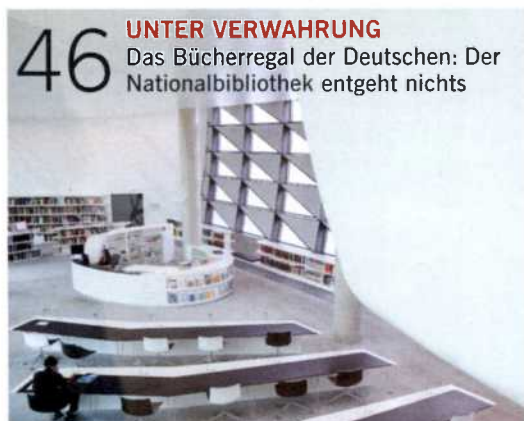
46 UNTER VERWAHRUNG Das Bücherregal der Deutschen: Der Nationalbibliothek entgeht nichts