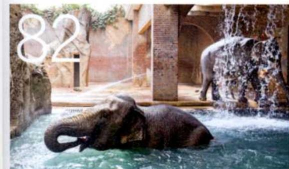
82 UNTER BEOBACHTUNG Selbst Tierschützer loben Leipzigs Zoo. Tiger und Affen leben in riesigen Gehegen, Elefanten baden im Tempel