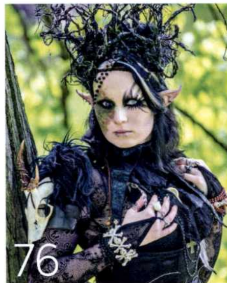
DUNKLE GESTALTEN Pfingsten wird Leipzig zum Treff fantastischer Figuren – meist etwas unheimlich