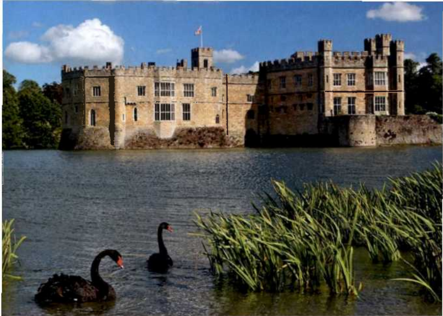
Normannisches Bollwerk und Burgfeste Heinrichs VIII.: Leeds Castle