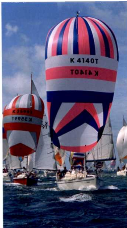
Spektakuläres Segelevent: die alljährliche Cowes Week rund um die Isle of Wight