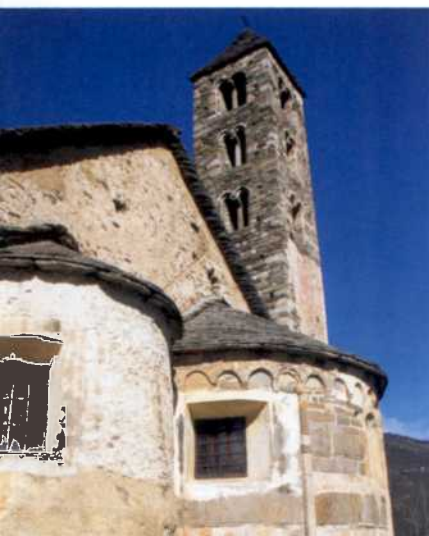
Höhepunkt romanischer Baukunst im Tessin: San Carlo di Negrentino