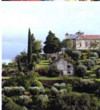
Oben: Das mittelalterliche Kleinod Óbidos Mitte: Tanznachmittag auf den Straßen von Setúbal Unten: In der grünen Mitte Portugals: eine Kirche bei Tomar