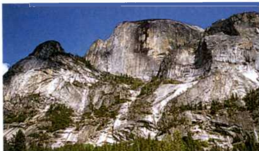
Half Dome im Yosemite National Park (siehe S. 492–495)