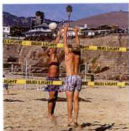
Volleyball am Pismo Beach (siehe S. 220f)