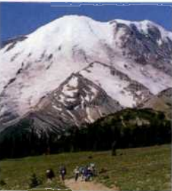
Emmons Glacier, Mount Rainier NP, Washington (siehe S. 188f)