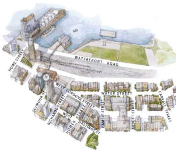
Vancouver: Hafenviertel und Gastown (siehe S. 204f)