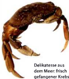
Delikatesse aus dem Meer: frisch gefangener Krebs