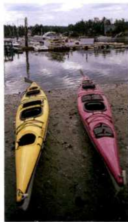
Kajaks in Snug Harbor, San Juan Island (siehe S. 182f), Washington