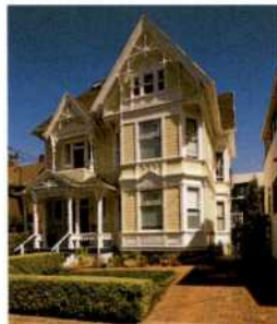
Viktorianisches Haus in Nob Hill, Portland (siehe S. 72)