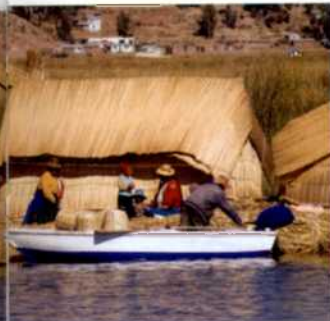
(siehe S. 150f)