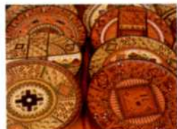
Bunt bemalte Teller auf einem Markt in Chinchero (siehe S. 172f)