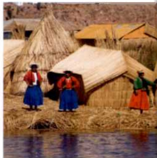
Bewohner der Islas Uros, Titicacasee