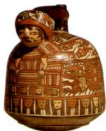
Mit Mustern verziertes Keramikgefäß, Nazca (siehe S. 132)