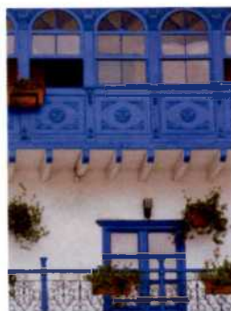
Leuchtend blaue Balkone, Cusco (siehe S. 160–163)