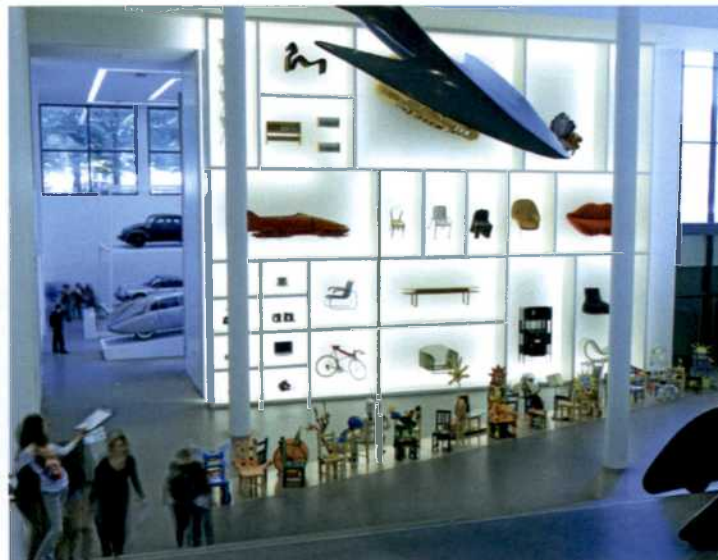
36 MODERNE KUNST | Münchens Museen in neuem Licht