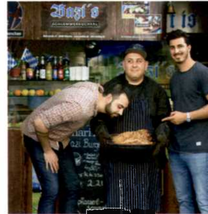
100 BRATEN 2.0 | Junge Wirte und ihre lässigen Ideen