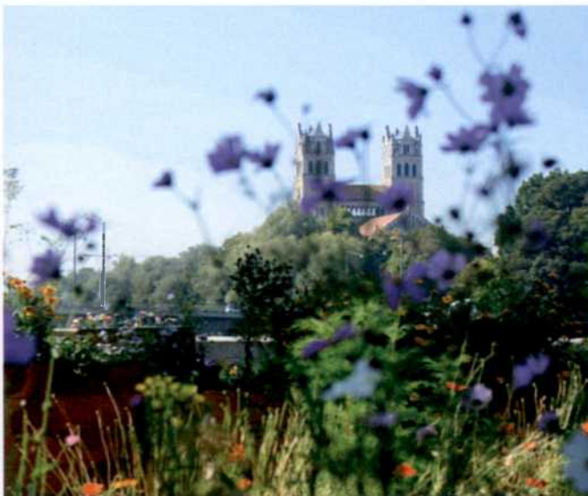
108 AUF DEM JAKOBSWEG | Ich geh dann mal in mich