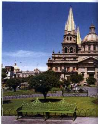
Plaza de Armas und Basilica in Guadalajara (siehe S. 192)