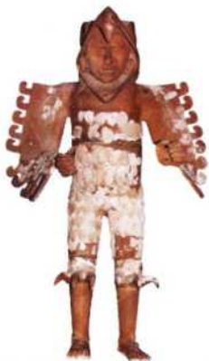
Aztekischer Adlerritter, Tonstatue im Museum des Templo Mayor, Mexico City (siehe S. 72–74)