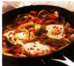
Huevos rancheros, das mexikanische Eiergericht (siehe S. 308)