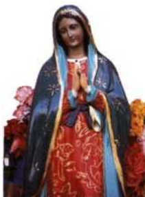
Jungfrau von Guadalupe, Mexikos Schutzpatronin (siehe S. 113)