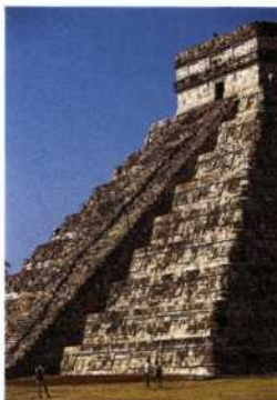
Die Maya-Pyramide El Castillo, Chichén Itzá auf der Halbinsel Yucatán (siehe S. 278–280)