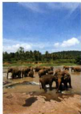
Elefanten am Ma Oya, Pinnawela Elephant Orphanage (siehe S. 143)