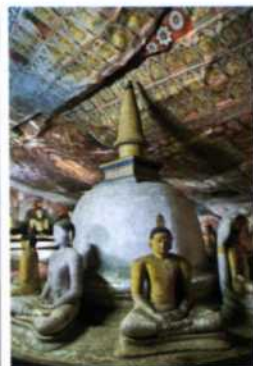
Figuren in Höhle II, Höhlentempel von Dambulla (siehe S. 162f)