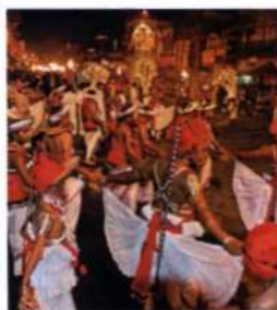
Tänzer beim buddhistischen Fest Esala Perahera, Kandy (siehe S. 139)