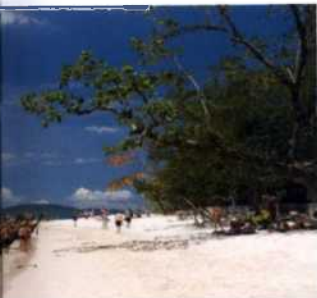
Phra Nang, Krabi (siehe S. 253)