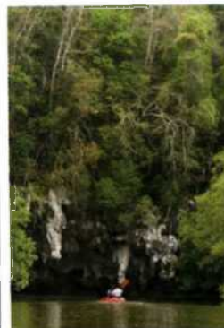
Grandiose Höhlenwelt, Than-Bok-Koranee-Nationalpark (siehe S. 249)