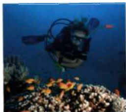
Bunte Unterwasserwelt der Korallenriffe, Ko Chang (siehe S. 130)