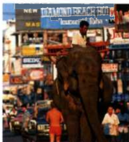
Ein Elefant auf einer belebten Straße in Süd-Pattaya (siehe S. 111)