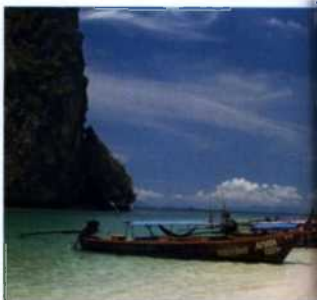
Langboote am idyllischen Hat Tham