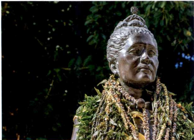
Queen Liliuokalanis blumengeschmückte Statue in Downtown Honolulu