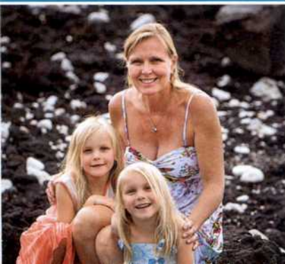
Blondes Trio am schwarzen Lavastrand von Big Island