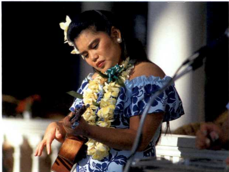
Ganz versunken: Musikerin mit Ukulele am Waikiki Beach