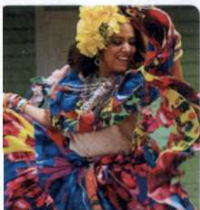
CONGO-TÄNZERIN PANAMA-STADT S. 696