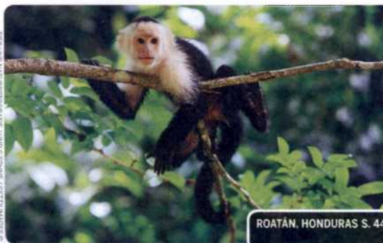
ROATÁN, HONDURAS S. 44