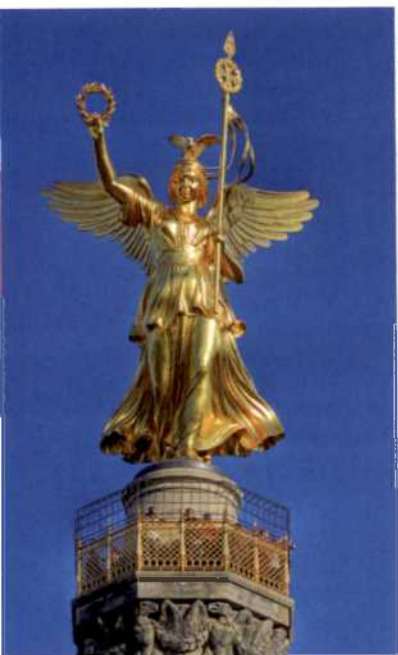
3098er Abb.: © Katja Xenikou