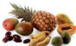
Auf den Kanarischen Inseln gedeihen exotische Früchte