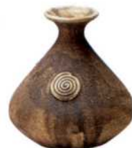
Tonvase im traditionellen Stil aus La Orotava (siehe S. 108–111)