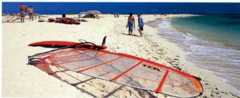
Sandstrand bei Corralejo auf Fuerteventura (siehe S. 70f)