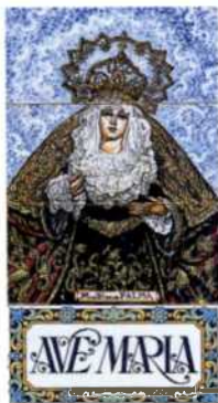
Madonna an einer Kirche in Santiago del Teide (siehe S. 116)