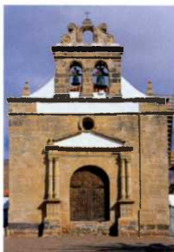
Die Kirche von Vega de Rio Palmas (siehe S. 75)