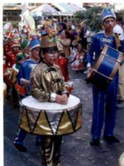
Kinder beim Karneval in Las Palmas de Gran Canaria (siehe S. 23)