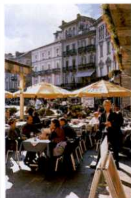
Die Piazza Grande in Locarno mit Cafés und Restaurants (siehe S. 218)