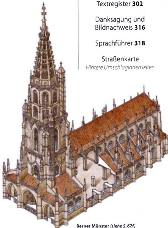
Berner Münster (siehe S. 62f)

Straßenkarte Hintere Umschlaginnenseiten