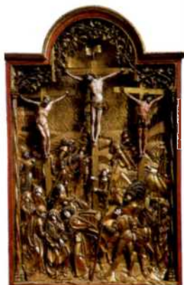
Altarbild von 1513, Église des Cordeliers, Fribourg (siehe S. 131)