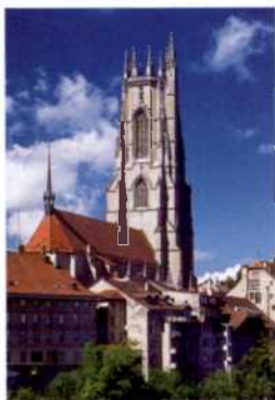
Die gotische Kathedrale St-Nicolas in Fribourg (siehe S. 130)