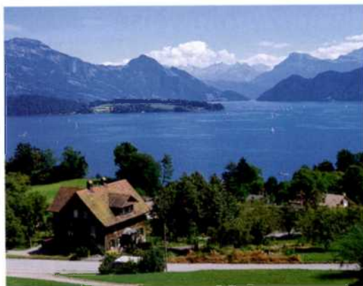
Der Vierwaldstättersee im Herzen der Schweiz (siehe S. 229)