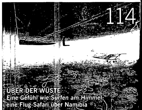
ÜBER DER WÜSTE Eine Gefühl wie Surfen am Himmel: eine Flug-Safari über Namibia