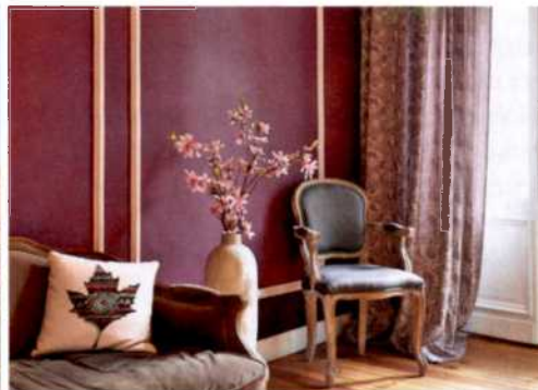
102 Zu schön, um auszugehen: 13 Hotels