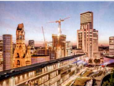
52 Wieder hip: Charlottenburg