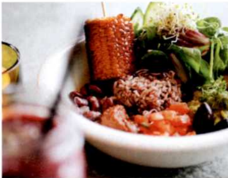
36 Bunte Vielfalt: Berliner Foodkreationen