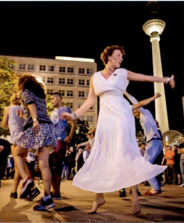
64 Tanzbar: Die neue Berliner Straßenmusik