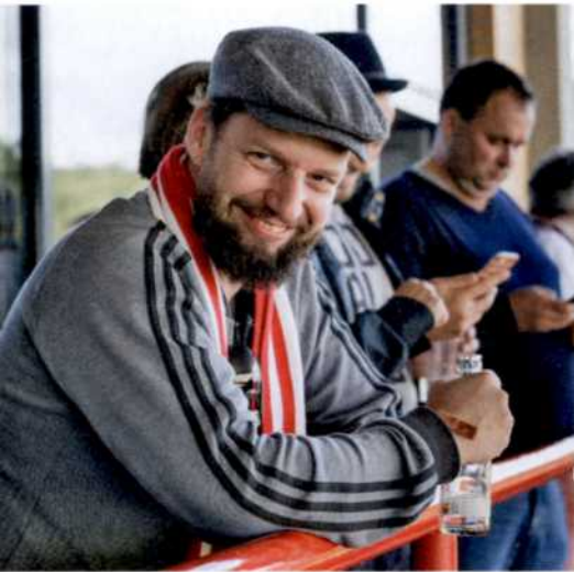
124 »Eisern treu«: Die Fans des 1. FC Union