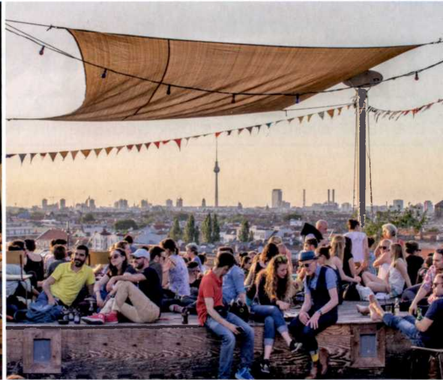
116 Ein Kiez, ein Lebensgefühl: Entspannen in Neukölln