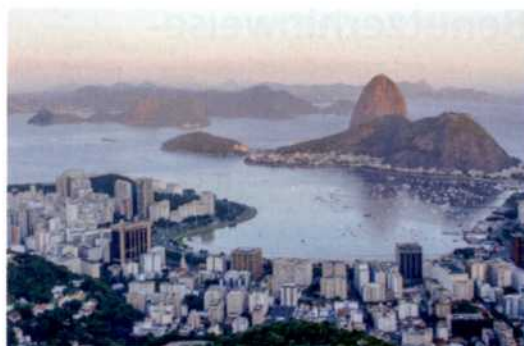
Blick auf Rio de Janeiro mit dem Zuckerhut (siehe S. 80f)