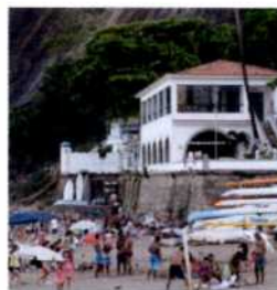
Restaurant an der Praia Vermelha am Zuckerhut (siehe S. 80f)