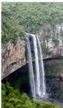
Imposanter Wasserfall im Parque do Caracol bei Canela (siehe S. 358)