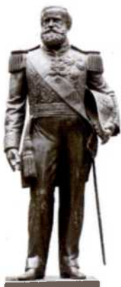
Statue von Dom Pedro II., Museu Imperial, Petrópolis (siehe S. 118f)