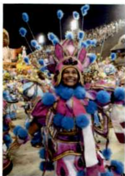
Sambaparade im Sambódromo von Rio de Janeiro (siehe S. 88f)