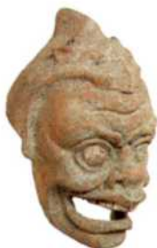
Antike Theatermaske, Museo Archeologico Eoliano (siehe S. 194)