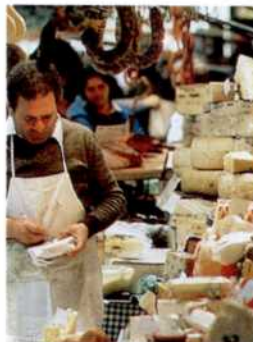
Ein Käseverkäufer auf dem Markt in Catania (siehe S. 218f)