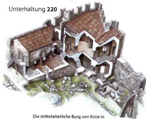
Die mittelalterliche Burg von Erice in Nordwest-Sizilien (siehe S. 37 und S. 104)