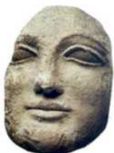
Frauenkopf aus dem 5. Jahrhundert v. Chr. (siehe S. 34f)