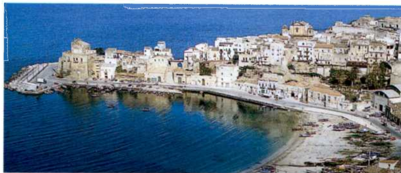
Castellammare del Golfo (siehe S. 100), eines der vielen Fischerdörfer an Siziliens Küste