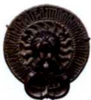
Türklopfen am Historisches Museum in Tallinn (siehe S. 64)