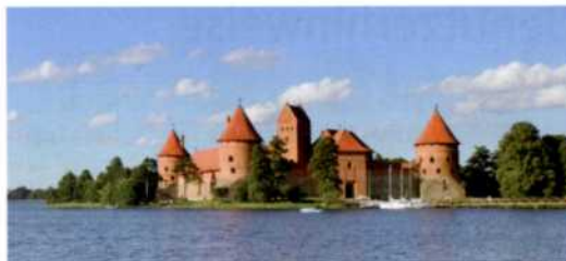
Inselfestung Trakai in Litauen (siehe S. 256f)