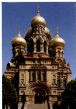
Nikolaus-Kathedrale in Karosta bei Liepāja, Lettland (siehe S. 185)