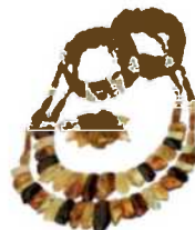
Bernsteinschmuck findet man in Souvenirläden im ganzen Baltikum