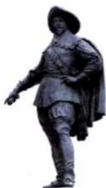
Statue von König Gustav Adolf in Tartu, Estland (siehe S. 118 -121)