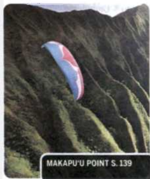
MAKAPU'U POINT S. 139