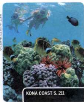
KONA COAST S. 211