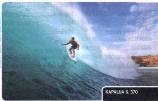
KAPALUA S. 370