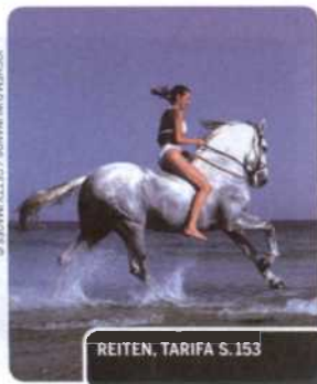
REITEN, TARIFA S. 153