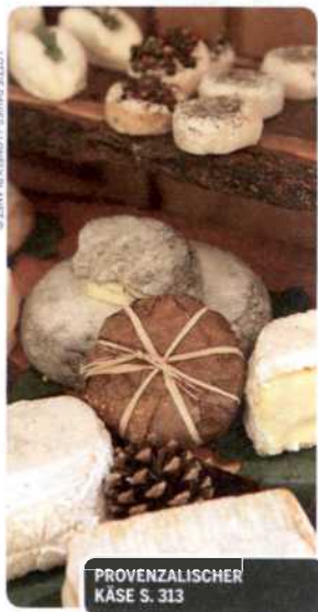
PROVENZALISCHER KÄSE S. 313