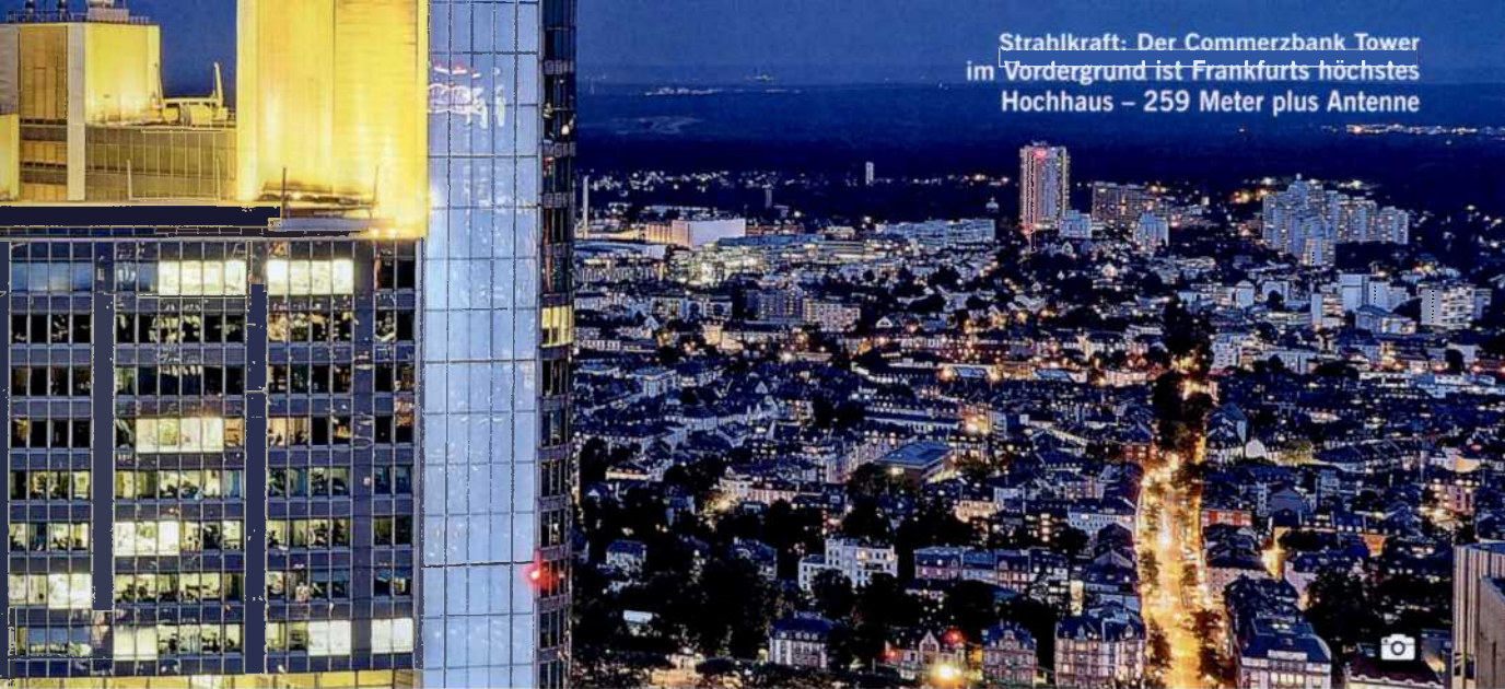
Strahlkraft: Der Commerzbank Tower im Vordergrund ist Frankfurts höchstes Hochhaus – 259 Meter plus Antenne