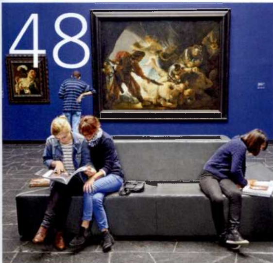
48 ANGESEHEN Das Museum Städel ist berühmt für seine erstklassige Sammlung. Und bekannt für spektakuläre Projekte