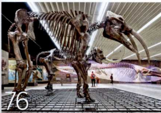
76 GIGANTISCH Das Senckenbergmuseum zeigt wahre Größe – wie diese Skelette von Urelfant, Mammut und Finnwal