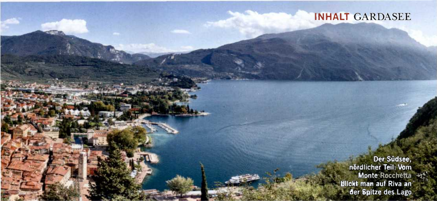
Der Südsee, nördlicher Teil: Vom Monte Rocchetta blickt man auf Riva an der Spitze des Lago