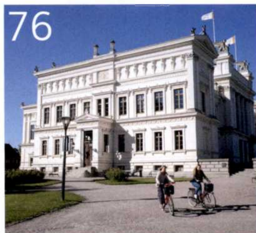
BEWUNDERNSWERT Spätestens an der Uni in Lund wird es jedem klar: Südschwedens Städte haben Charme und Format