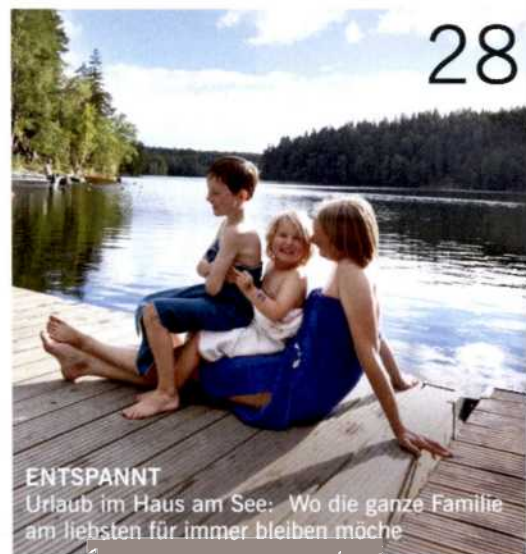
ENTSPANNT Urlaub im Haus am See: Wo die ganze Familie am liebsten für immer bleiben möchte