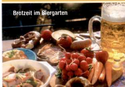
Brotzeit im Biergarten