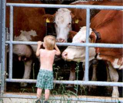
Auf dem Bauernhof: Ferien mit Kindern

→ OBERBAYERN FÜR KINDER UND FAMILIEN 282