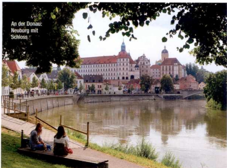
An der Donau: Neuburg mit Schloss