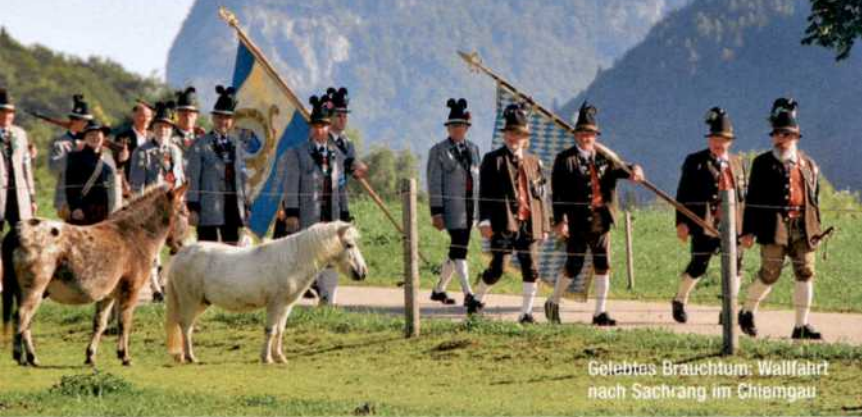
Gelebtes Brauchtum: Wallfahrt nach Sachrang im Chiemgau