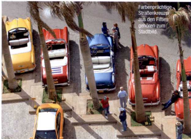
Farbenprächtige Straßenkreuzer aus den Fifties gehören zum Stadtbild.