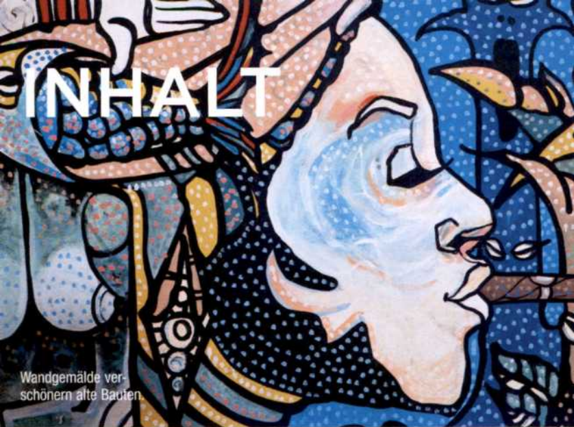
Wandgemälde ver- schönern alte Bauten

Das sollten Sie sich nicht entgehen lassen 9 Kuba – Aus der Zeit gefallen 12