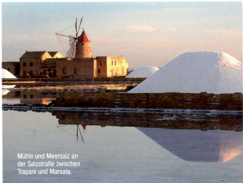
Mühle und Meersalz an der Salzstraße zwischen Trapani und Marsala.