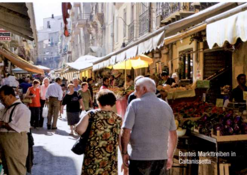
Buntes Marktreiben in Caltanissetta