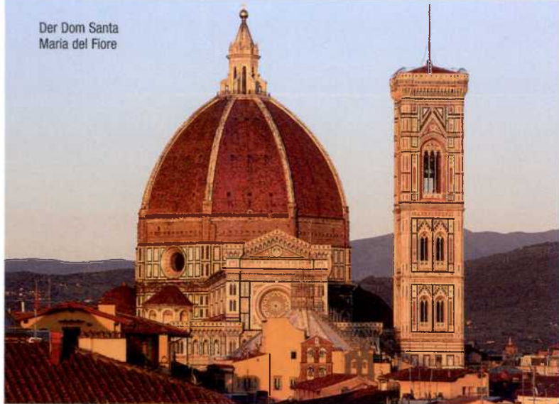
Der Dom Santa Maria del Fiore