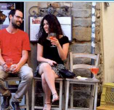
Im Quartiere di Santo Spirito