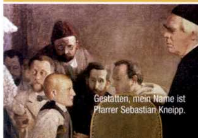
Gestatten, mein Name ist Pfarrer Sebastian Kneipp.