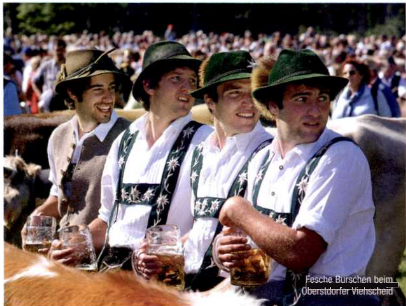
Fesche Burschen beim Oberstdorfer Viehscheid