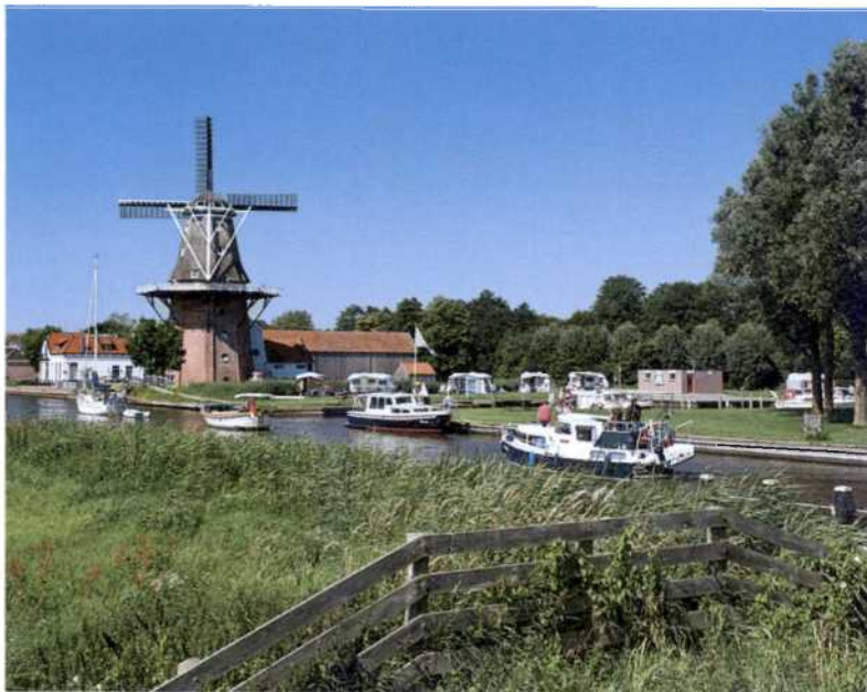
Friesisches Stillleben: Unweit der Küste warten altholländische Landschaften.