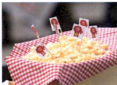
Dieser Snack geht immer: gewürfelter Käse auf dem Markt in Alkmaar.