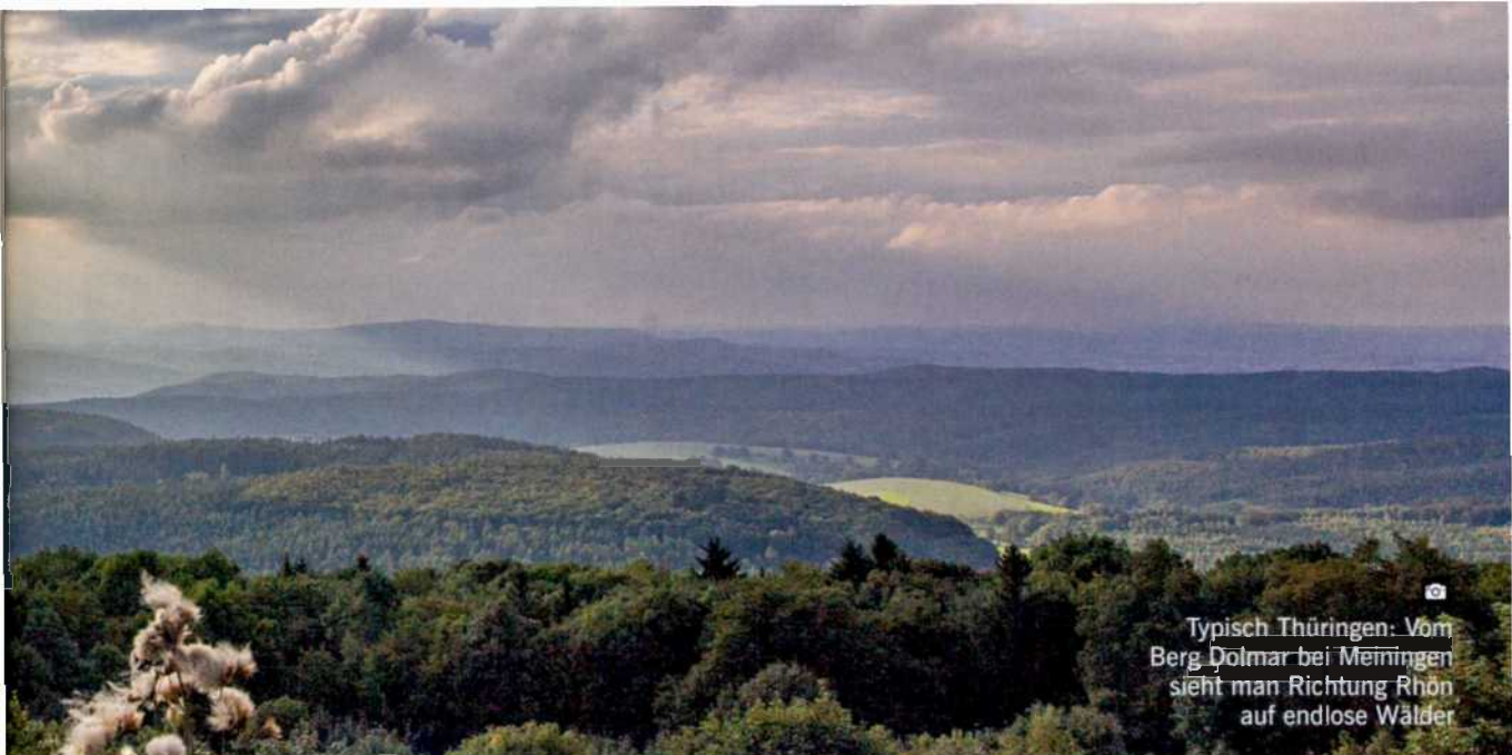
Typisch Thüringen: Vom Berg Dolmar bei Meiningen sieht man Richtung Rhön auf endlose Wälder