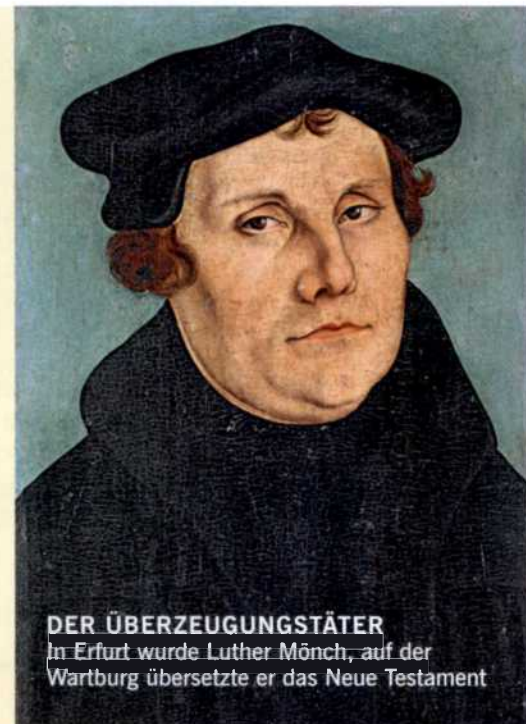
DER ÜBERZEUGUNGSTÄTER In Erfurt wurde Luther Mönch, auf der Wartburg übersetzte er das Neue Testament