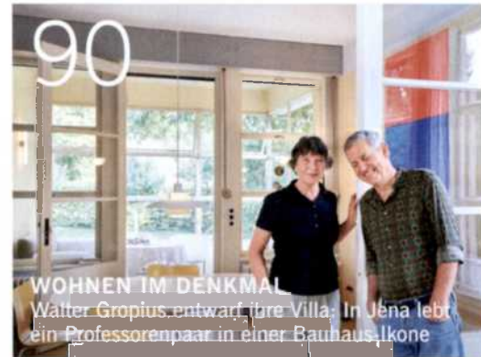
WOHNEN IM DENKMAL Walter Gropius entwarf ihre Villa. In Jena lebt ein Professorenpaar in einer Bauhaus-Ikone