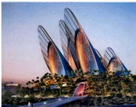
88 Abu Dhabi: Grandiose Museen