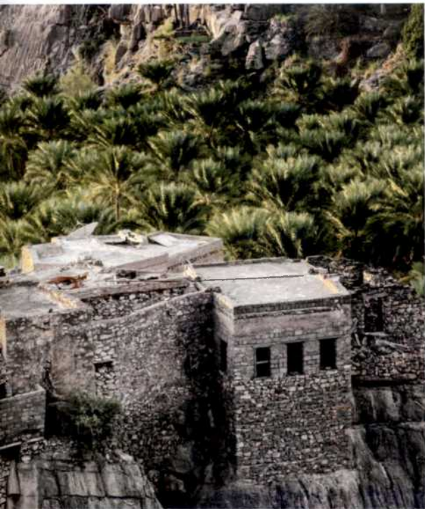
52 Klassiker-Route: In den Bergdörfern des Oman