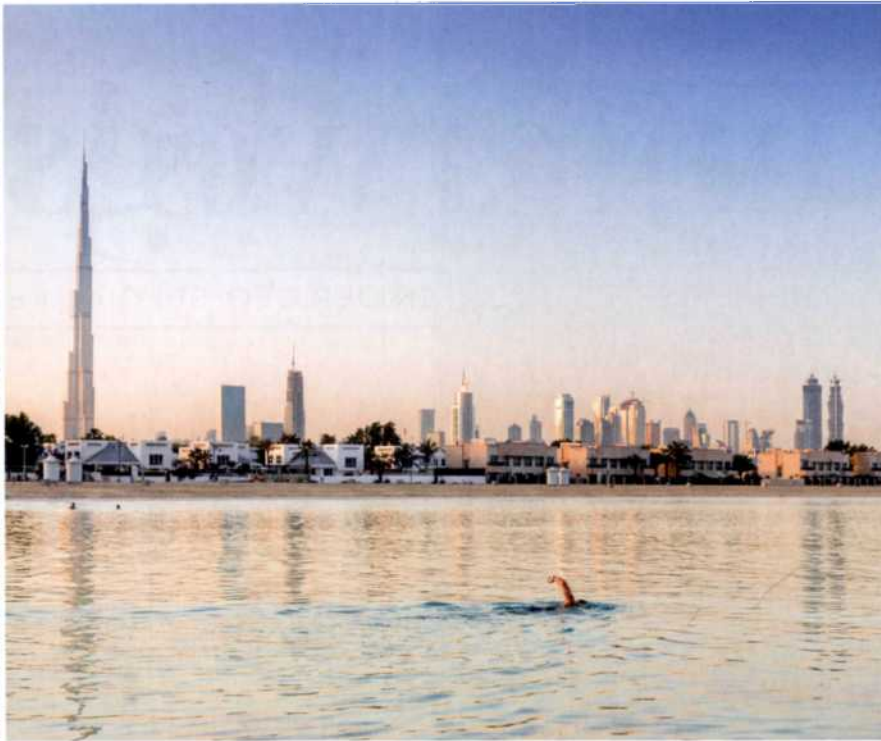
34 Dubai: Entdeckungen in der Megacity