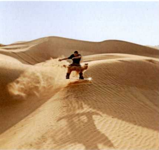
122 Aktiv: Sandboarden in Dubais Dünen