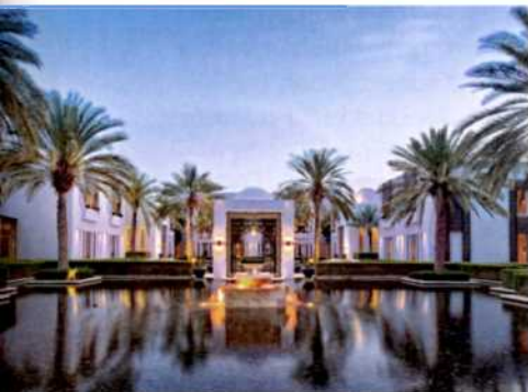
78 Hotels: Luxuspaläste unter Palmen