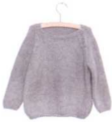
Helsinki, Seite 30