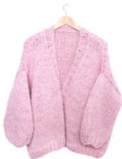
Florenz, Seite 86