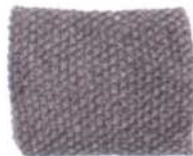
Kopenhagen, Seite 26