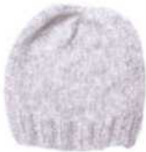
Oslo, Seite 24