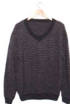
Malmö, Seite 42