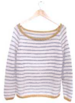
Dover, Seite 50