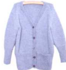
Brüssel, Seite 100