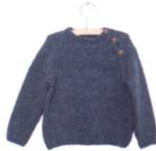
Calvi, Seite 110