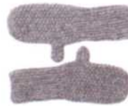
Stockholm, Seite 28