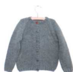
Bastia, Seite 106