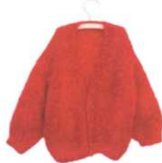
Florenz (rot), Seite 88