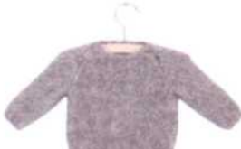
Toulouse, Seite 62