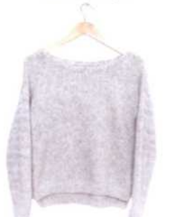
Rennes, Seite 116