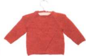
Ankara, Seite 124