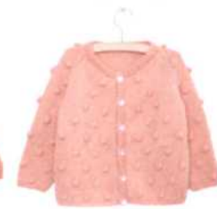
Venedig, Seite 94