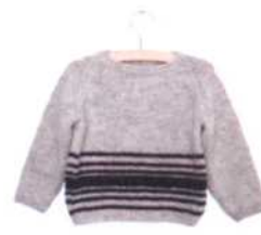
Nantes, Seite 118