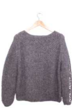
Helsinki, Seite 22