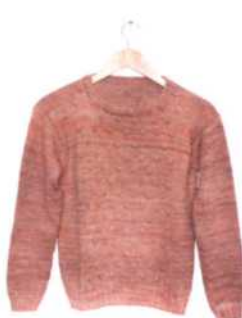
Venedig, Seite 90