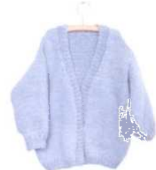
Florenz (blau), Seite 87