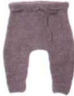
Montpellier, Seite 64