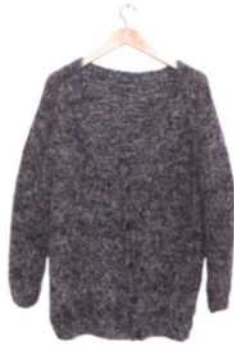
Reykjavik, Seite 36