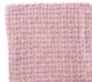
Warschau, Seite 114