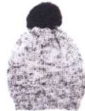
Dublin, Seite 32