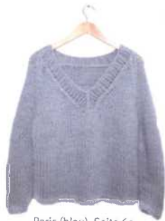
Paris (blau), Seite 60