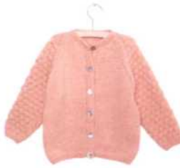
Pisa, Seite 92