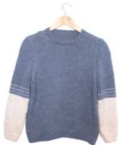
Chamonix, Seite 108