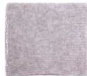
Nizza, Seite 66