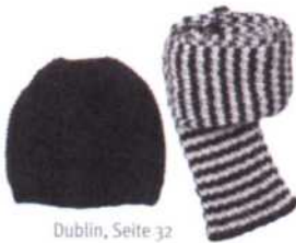
Dublin, Seite 32