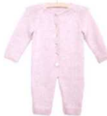
Skopje, Seite 74