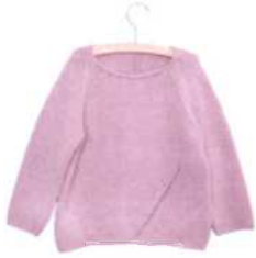
Ankara, Seite 68