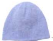
Mailand, Seite 102