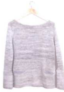
Valletta, Seite 46