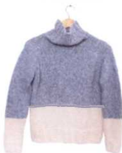
Genf, Seite 112