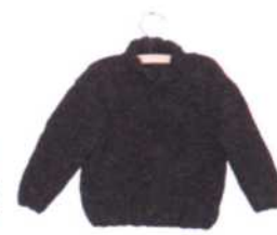
Hannover, Seite 120