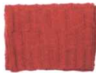
Amsterdam, Seite 45