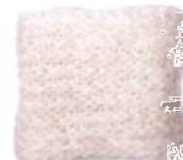
Warschau, Seite 114