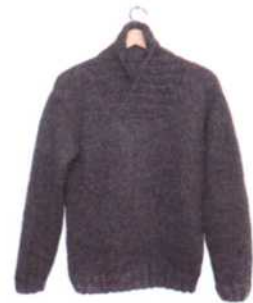
Hannover, Seite 122