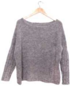
Barcelona, Seite 54