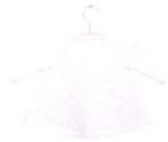
Sofia, Seite 38