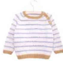
Dover, Seite 52