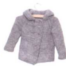
Pristina, Seite 58