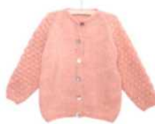
Pisa, Seite 96