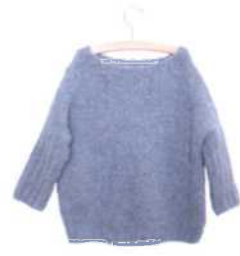
Barcelona, Seite 56