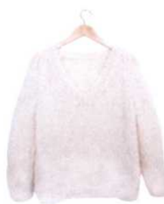
Paris (weiß), Seite 60/65