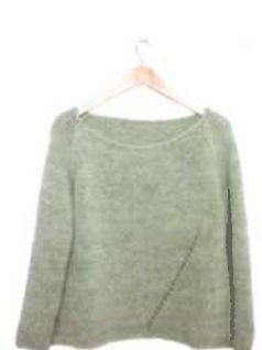
Ankara, Seite 104