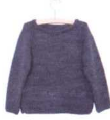
Odessa, Seite 48