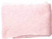
Lissabon, Seite 78