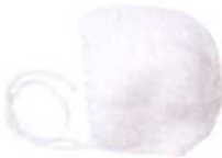
New Delhi, Seite 82