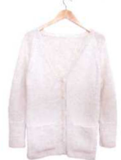
Brüssel, Seite 98