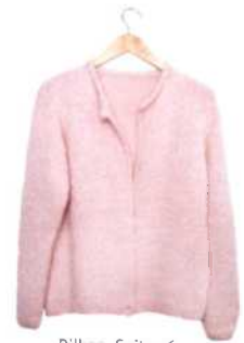
Bilbao, Seite 76