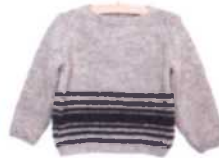
Nantes, Seite 118