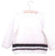
London, Seite 34