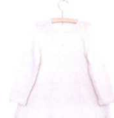
Sofia, Seite 84