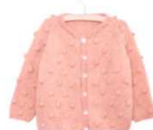
Venedig, Seite 80