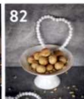
82 Spanische Pinienkernkugeln