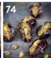
74 Persische Datteln mit Pistazien