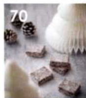
70 Elsässer Nussnougat- «Sandsteine»