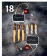
18 Ingwer- und Mohnstangen