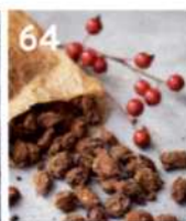
64 Gebraunte Mandeln