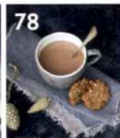
78 Mexikanische heiße Schokolade