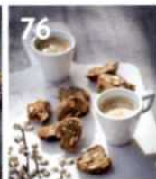
76 Italienische Anis- Mandel-Cantuccini