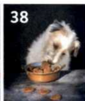
38 Weihnachtsplätzchen für 4-Beiner