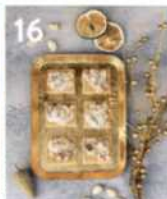
16 Weiße Schokoladen-Mandel-Kekse