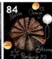
84 Italienisches Panforte