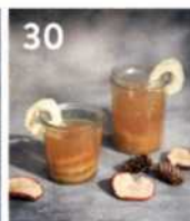
30 Apfelpunsch (alkoholfrei)