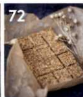
72 Türkisches Halva-Konfekt