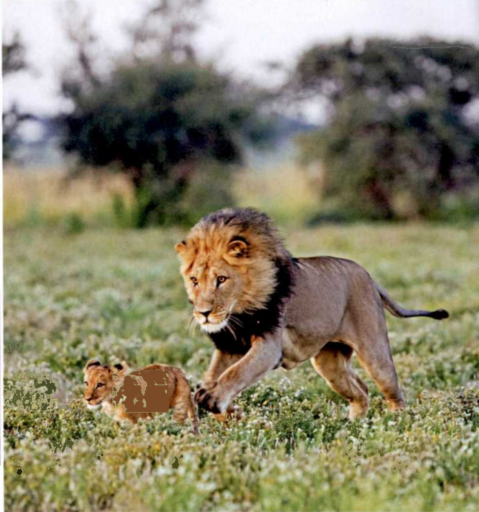
18 Frei geboren: Eine Fotosafari durch Namibia und Botswana