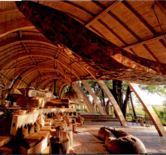
60 Die schönsten Lodges und Camps