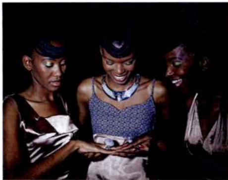
82 Botswana: Im Diamanten-Rausch