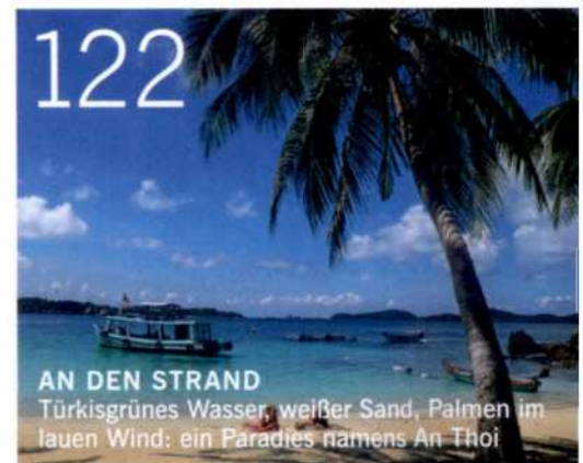
AN DEN STRAND Türkisgrünes Wasser, weißer Sand, Palmen im lauen Wind: ein Paradies namens An Thoi