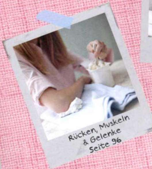
Rücken, Muskeln & Gelenke Seite 96