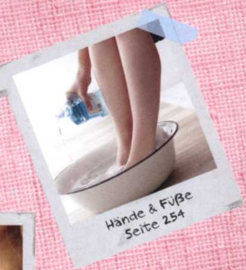
Hände & Füße Seite 254