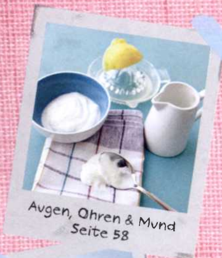
Augen, Ohren & Mund Seite 58