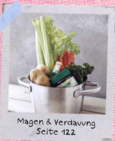
Magen & Verdauung Seite 122