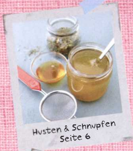
Husten & Schnupfen Seite 6