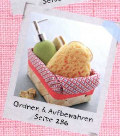
Ordnen & Aufbewahren Seite 286