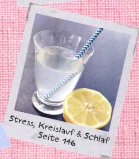
Stress, Kreislauf & Schlaf Seite 146