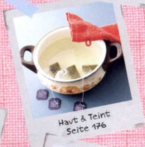
Haut & Teint Seite 176