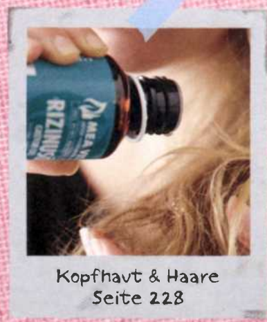
Kopfhaut & Haare Seite 228