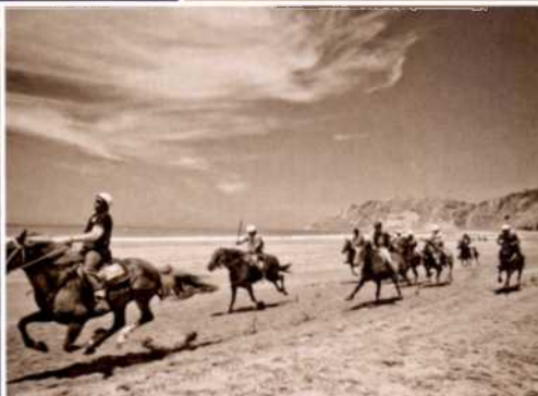
44 Klassiker-Route: Unterwegs auf der Coromandel-Halbinsel und zur Cathedral Cove