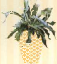
GEWEIHFARN Platynerium bifurcatum S. 110-111