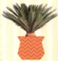
JAPANISCHER SAGOPALMFARN Cycas revoluta S. 139