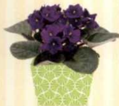
USAMBARAVEILCHEN Saintpaulia S. 112-113