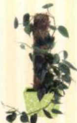
KLETT- PHILODENDRON Philodendron scandens S. 63