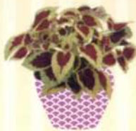
BUNTNESSEL Solenostemon S. 135