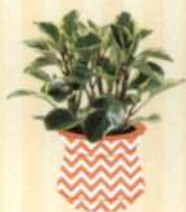
ZWERGPFEEFER Peperomia obtusifolia S. 101