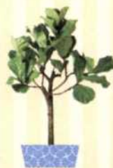
GEIGEN-FEIGE Ficus lyrata S. 76-77