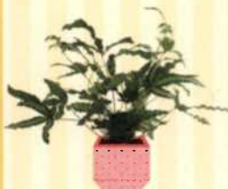
KRETISCHER SAUMFARN Pteris cretica S. 33