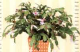
OSTERKAKTUS Schlumbergera gaertneri S. 121