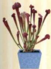
SCHLAUCHPFLANZE Sarracenia S. 65