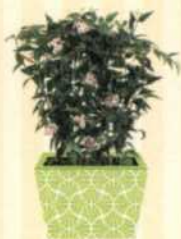
ZWERG- PORZELLANBLUME Hoya bella S. 89