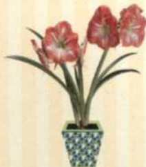
AMARYLLIS Hippeastrum S. 82-83