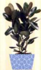
GUMMIBAUM Ficus elastica S. 77