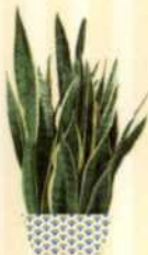
SCHWIEGERMUTTER- ZUNGE Sansevieria trifasciata S. 114-115