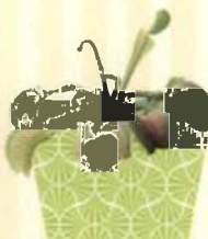
VENUSFLIEGENFALLE Dionaea muscipula S. 64-65