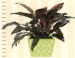
ROTBLÄTTRIGER PHILODENDRON Philodendron erubescens S. 63