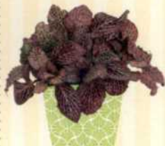
SILBERNETZ- BLATT Fittonia S. 78-79