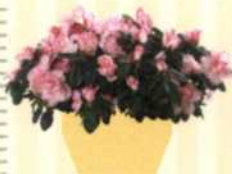
ZIMMER-AZALEE Rhododendron simsii S. 61