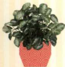
VERÄNDERLICHE PURPURTUTE Syngonium podophyllum S. 53