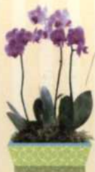
SCHMETTERLINGS- ORCHIDEE Phalaenopsis S. 102-103