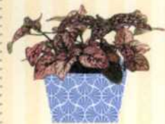
PUNKTBLUME Hypoestes phyllostachya S. 79