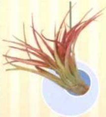
TILLANDSIEN Tillandsia S. 132-133