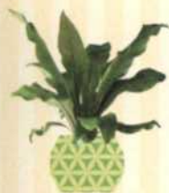
NESTFARN Asplenium nidus S. 97