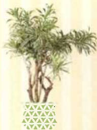
GERANDETER DRACHENBAUM Dracaena reflexa S. 69