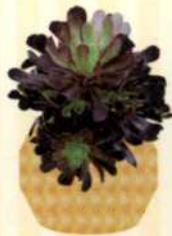
ROSETTEN- DICKBLATT Aeonium S. 73