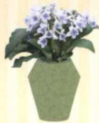
DREHFRUCHT Streptocarpus S. 130-131