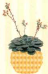
ECHEVERIE Echeveria S. 72-73