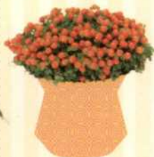
KORALLENMOOS Nertera granadensis S. 123