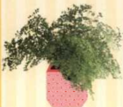
FRAUENHAARFARN Adiantum raddianum S. 32-33