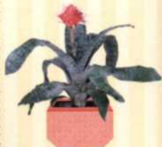
LANZENROSETTE Aechmea fasciata S. 34-35