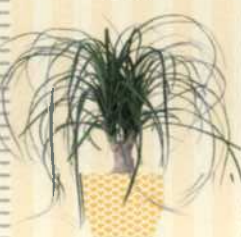
ELEFANTENFUSS Beaucarnea recurvata S. 137