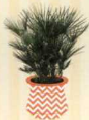
EUROPÄISCHE ZWERG PALME Chamaerops humilis S. 105