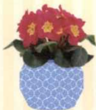
KISSEN-PRIMEL Primula vulgaris S. 55