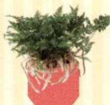
KANARISCHER HASENPFOTENFARN Davallia canariensis S. 33