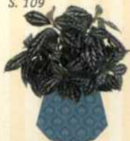
VIETNAMESSISCHE KANONIERBLUME Pilea cadierei S. 109