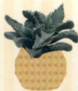
TIGERRACHEN Faucaria S. 73