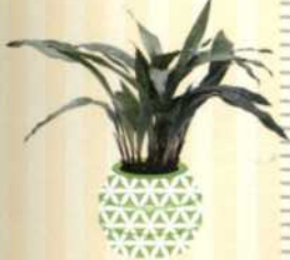
SCHUSTERPALME Aspidistra S. 125