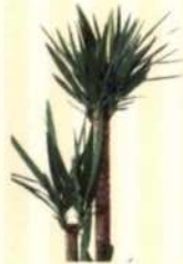
PALMLILIE Yucca elephantipes S. 136-137