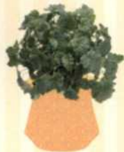
HENNE MIT KÜKEN Tolmiea menziesii S. 123