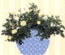
TOPFROSE Rosa S. 55