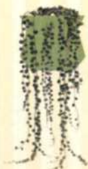
ERBSENPFLANZE Senecio rowleyanus S. 59