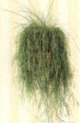
BINSENKAKTUS Rhipsalis baccifera S. 121