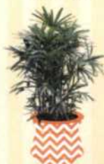
HOHE STECKENPALME Rhaps excelsa S. 105