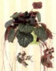
JUDENBART Saxifraga stolonifera S. 116-117