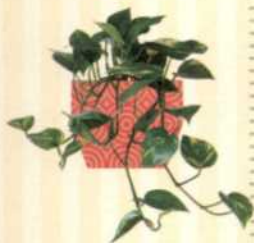
EFEUTUTE Epipremnum S. 53