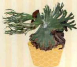
GROSSER GEWEIHFARN Platycerium grande S. 111