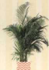
GOLDFRUCHTPALME Dypsis lutescens S. 85