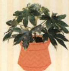
ZIMMERARALIE Fatsia japonica S. 81