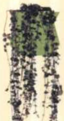
LEUCHTERBLUME Ceropogia woodii S. 59