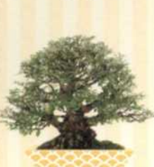
ZIMMER-BONSAI Verschiedene Arten S. 140-141