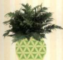
RIPPENFARN Blechnum gibbum S. 97