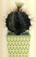
MÖNSCHKAPPE Asphytum ornatum S. 99