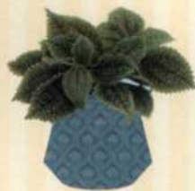
EINGEHÜLLTE KANONIERBLUME Pilea involucrata 'Moon Valley' S. 109