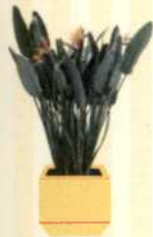
PARADIESVOGELBLUME Strelitzia reginae S. 128-129