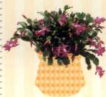
WEIHNACHTSKAKTUS Schlumbergera x buckleyi S. 120-121