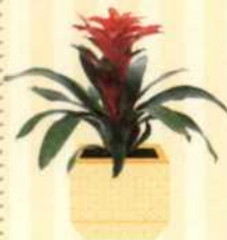
GUZMANIE Guzmania lingulata S. 35