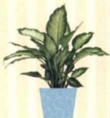
DIEFFENBACHIE Dieffenbachia S. 62-63