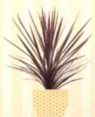
KEULENLILIE Cordyline australis S. 137