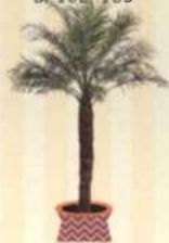
ZWERG-DATTEPALME Phoenix roebelenii S. 104-105