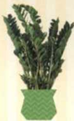
GLÜCKSFEDER Zamioculcas zamiifolia S. 138-139