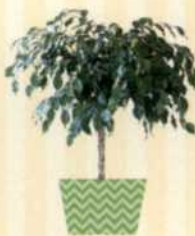
BIRKEN-FEIGE Ficus benjamina S. 77