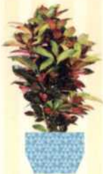
KROTON Codiaeum variegatum S. 119