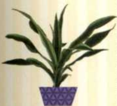
DRACHENBAUM Dracaena fragrans S. 68-69