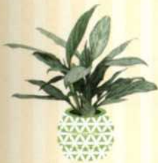
KOLBENFADEN Aglaonema S. 125