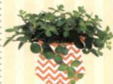
ZWERGPFEEFER Peperomia rotundifolia S. 101