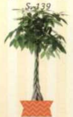
GLÜCKSKASTANIE Pachira aquatica S. 139