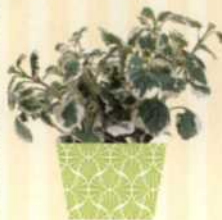
MOTTENKÖNIG Platanthus S. 117