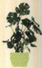
GROSSES FENSTERBLATT Monstera deliciosa S. 94-95