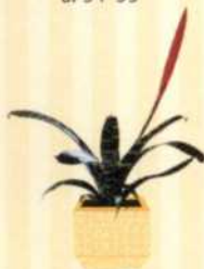
FLAMMENDES SCHWERT Vriesea splendens S. 35