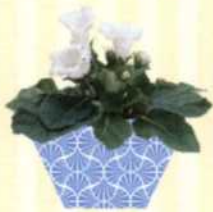
GLOXINIE Sinningia speciosa S. 131