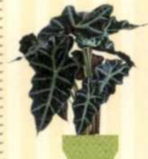
PFEILBLATT Alocasia amazonica S. 36-37