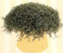
BUBIKOPF Soleirolia soleirolii S. 122-123