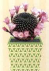
REBUTIA Rebutia S. 99