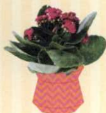
CALANDIVA Kalanchoe Calandiva®-Serie S. 91