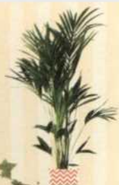
KENTIAPALME Howea forsteriana S. 84-85