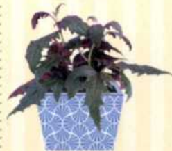
SAMTPFLANZE Gynura aurantiaca S. 79