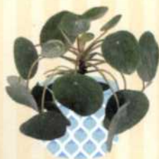
UFOPFLANZE Pilea peperomioides S. 108-109