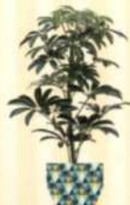
STRAHLENARALIE Schefflera arboricola S. 118-119