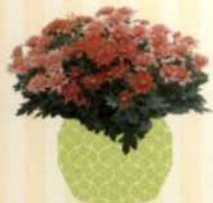
CHRYSANTHEME Chrysanthemum S. 54-55