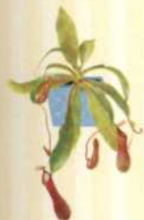
KANNENPFLANZE Nepenthes S. 65