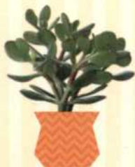
GELDBAUM Crassula ovata S. 58-59