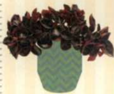
ZWERGPFEEFER Peperomia metallica S. 100-101