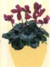
ALPENVEILCHEN Cyclamen persicum S. 60-61