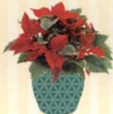
WEIHNACHTSSTERN Euphorbia pulcherrima S. 74-75