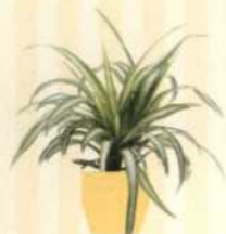
GRÜNLILIE Chlorophytum comosum S. 52-53