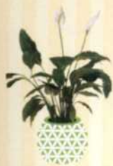
EINBLATT Spathiphyllum S. 124-125