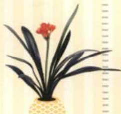
RIEMENBLATT Clivia miniata S. 56-57