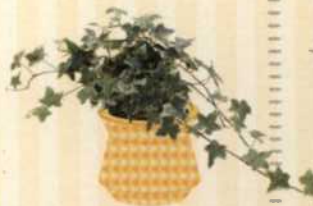
EFEU Hedera helix S. 80-81