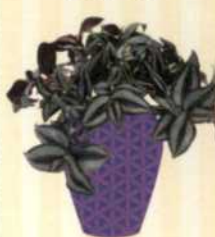
ZEBRAKRAUT Tradescantia zebrina S. 134-135