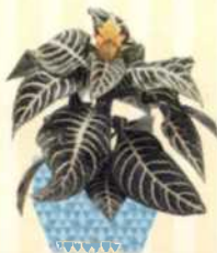
GLANZKÖLBCHEN Aphelandra squarrosa S. 119