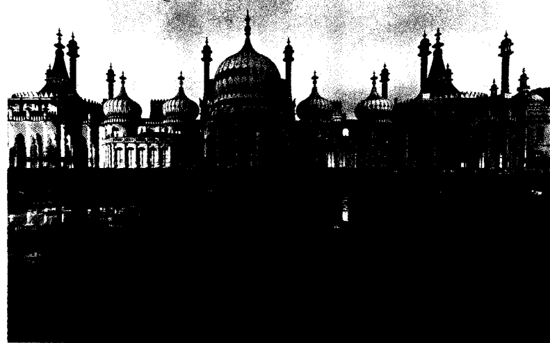
Erinnerung an koloniale Zeiten – der Royal Pavilion in Brighton