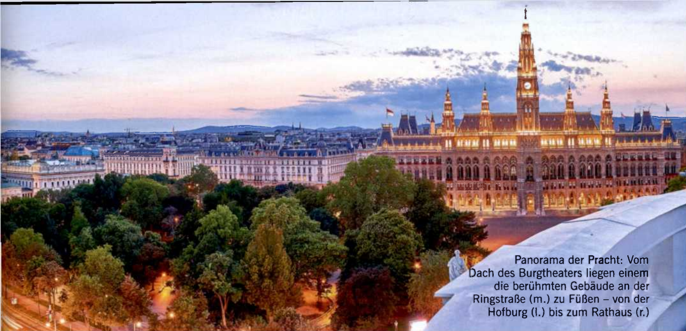
Panorama der Pracht: Vom Dach des Burgtheaters liegen einem die berühmten Gebäude an der Ringstraße (m.) zu Füßen – von der Hofburg (l.) bis zum Rathaus (r.)