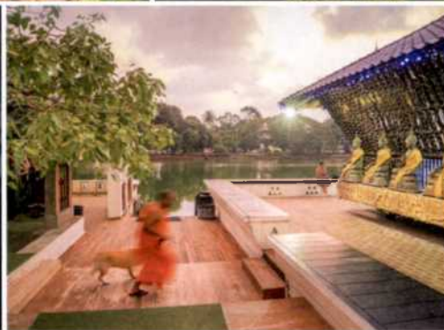
44 Klassiker-Route im Herzen des Landes: Zum Monolith von Sigiriya und zu Königsstädten