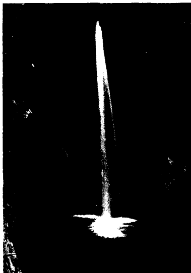
Wasserfallschleier der Plitwitzer Seen