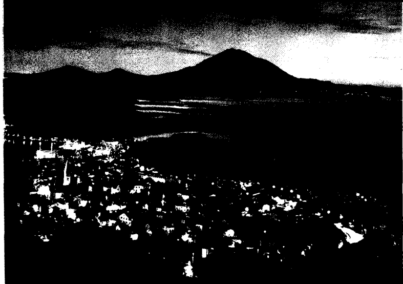
Abendstimmung auf Lošinj