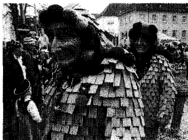
Hästräger auf der Konstanzer Fasnacht sorgen für viel Lokalkolorit.