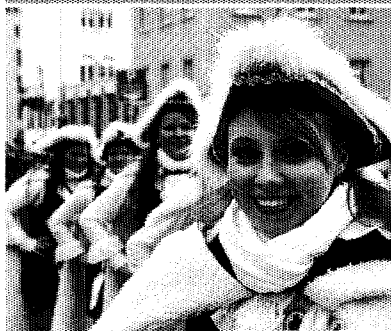
Ausgelassene Stimmung beim Konstanzer Fasnachtsumzug