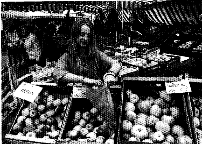
Im Herbst ist das Apfelerangebot auf den Märkten riesig, alte Sorten muss man allerdings oft suchen.