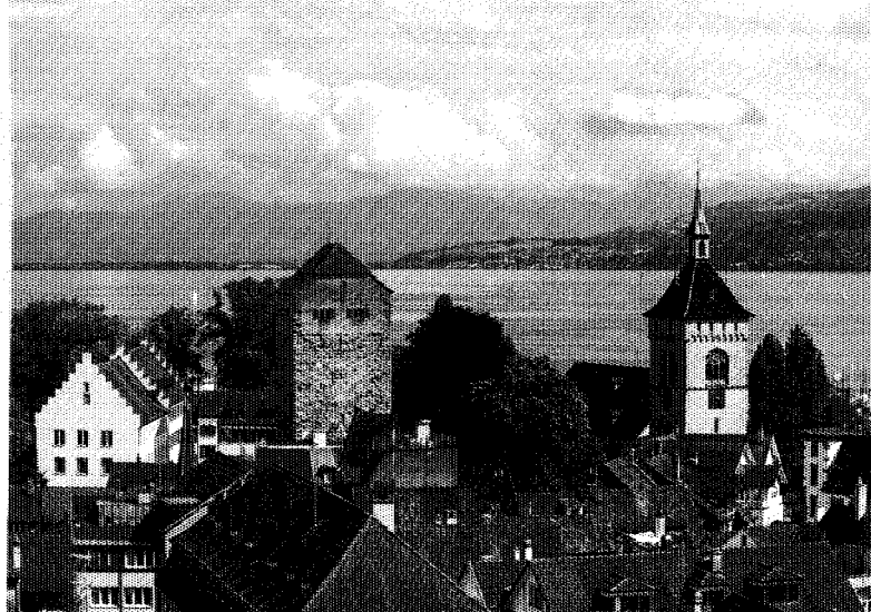
Spätmittelalterliche Türme prägen die Silhouette von Arbon am Schweizer Ufer.