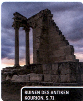
RUINEN DES ANTIKEN KOURION, S. 71