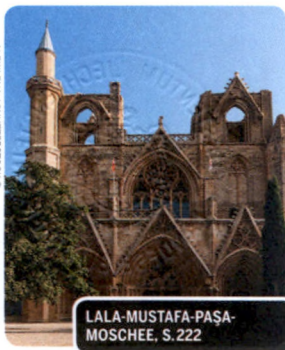
LALA-MUSTAFA-PASA-MOSCHEE, S. 222